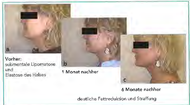
Abbildung 1: Laserlipolyse 1470 nm (LipoLife®) am Hals weiblich, 50 Jahre, Suktion mit integrierter Angel-Barefiber, 8 W pulsed mode, 2 kJ/100 cm 2

Nach retrospektiver Auswertung unserer Daten zu den Risiken der Laserlipolyse sind Nebenwirkungen wie flache Hämatome, Wundergüsse und ödematöse Schwellungen häufiger aufgetreten. Gele-