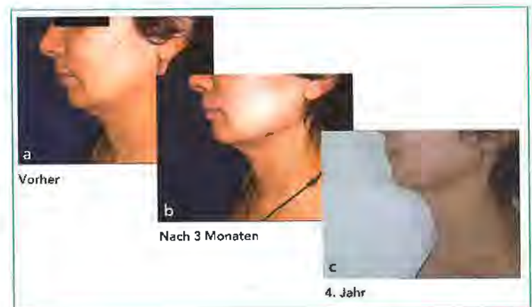
Abbildung 2: Effizienz und Nachhaltigkeit der Laserlipolyse 980 nm (FOX®) weiblich, 53 Jahre, moderate Dermatochalis am oberen Hals

entlich kommen subkutane Panzerungen im Sinne einer fibratischen Reaktion vor, die passager über 1 bis 3 Monate auftreten. (4). Andere Komplikationen wie Infektionen oder Nekrosen sind sehr selten. Das gefürchtete Risiko für thermische Nervenschädigungen von Fazialisästen ist bei der Anwendung der reinen Barefiber-Technik oberhalb der Kinnlinie deutlich höher einzuschätzen.