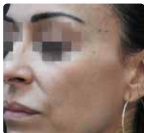
Nach 4 Behandlungen