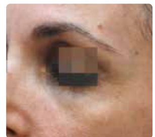
Nach 3 Behandlungen